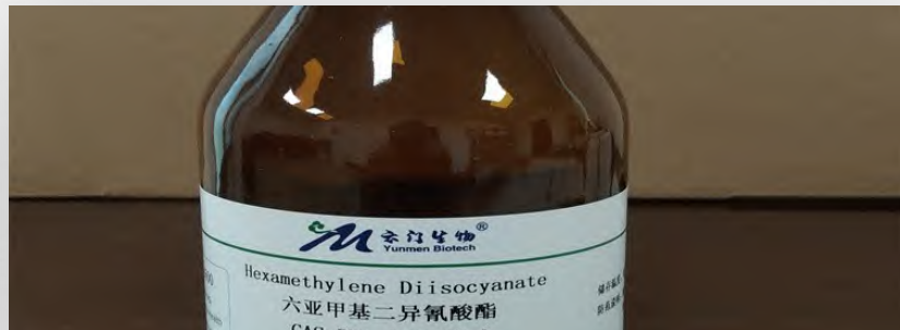
异氰酸酯化学品原料

提供关键的反应活性位点，是形成材料刚性骨架的核心，决定了产品的硬度、强度与耐热性。